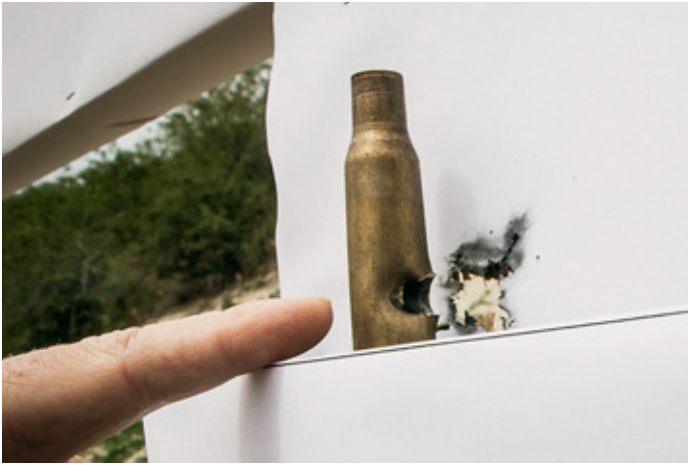
Из венгерских «специалитетов» – стрельба по мишеням из «подручных материалов»

припасли, а участие в соревнованиях второй год подряд монгольской команды объясняется вовсе не стремлением наследников Чингисхана вступить в Евросоюз, а тем, что компания CZ продаёт туда винтовки.