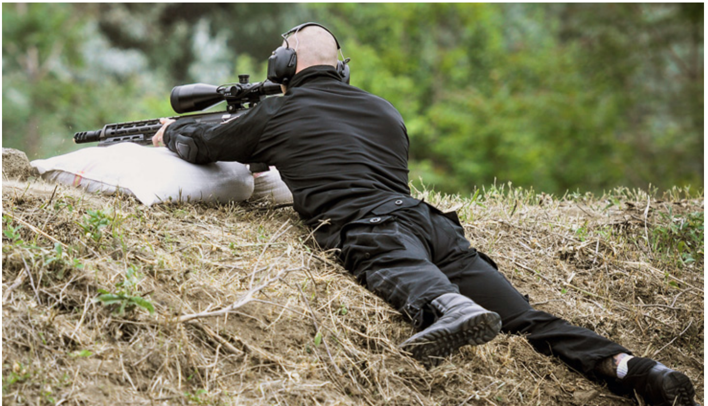
Татуировка на правой голени этого стрелка выдаёт его принадлежность к одному из очень закрытых подразделений

Как бы в порядке реабилитации за скандальную атмосферу прошлого кубка в этот раз венгры разрешили пристрелку оружия на трёх дистанциях – 100, 200 и 300 м. Кроме того, за пару недель до начала соревнований организаторы объявили об увеличении дальностей до 750 м относительно прошлых 420 м. Это, конечно, совпадение, а не предпочтение домашним командам и зависшим