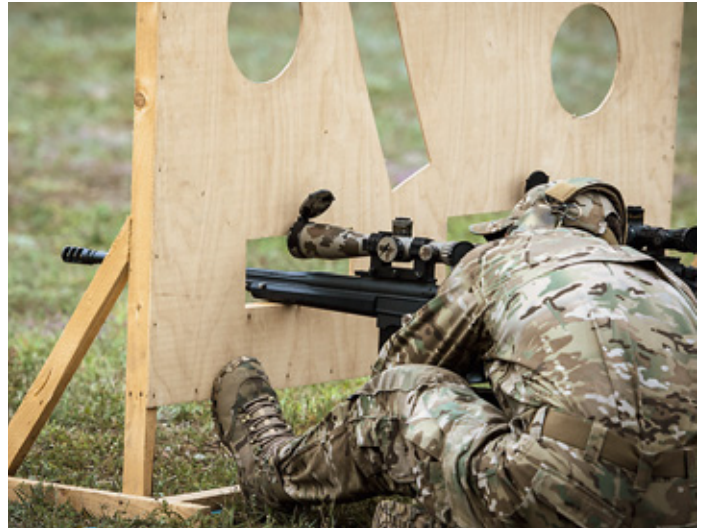
Некоторые порты были столь узкими и в неустойчивой опоре, что делало почти невозможной стрельбу из винтовок с крупным цевьём и высоко установленной оптикой

На кубок заявили 66 команд из 17 стран мира, представляющих в основном континентальную Европу