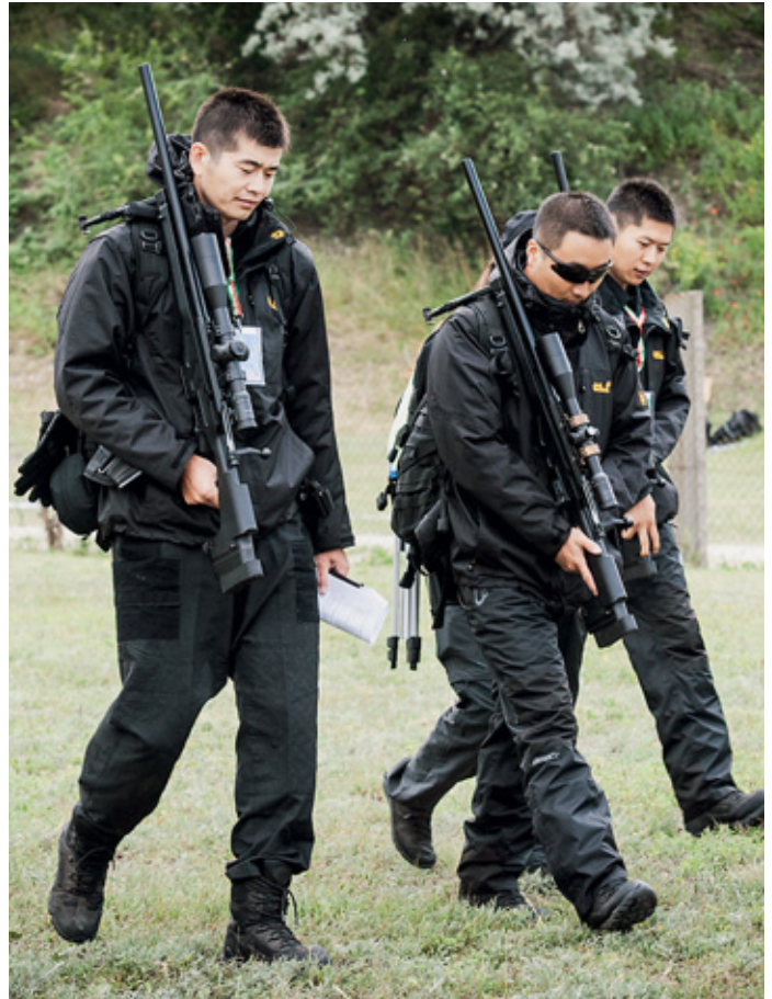
Всё говорит о том, что представленность азиатского региона на международных матчах будет расти

Таким образом, эти соревнования стали первой публичной обкаткой тактических винтовок «Орсис», и надо отдать должное снайперам из московской и краснодарской «Альфы», которые решились использовать новые изделия на столь ответственном мероприятии. Причём, если