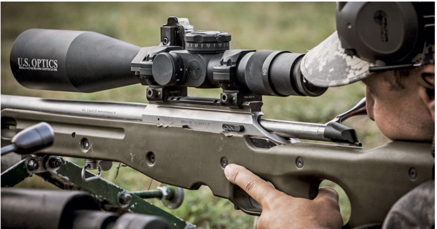
Оптический прицел (U.S. Optics) на этой винтовке (Tikka Т3) стоит дороже самого оружия, даже с неоригинальной ложей. У «Тикки» вообще репутация непревзойдённой винтовки для варминта и снайпинга по критерию «цена-качество»